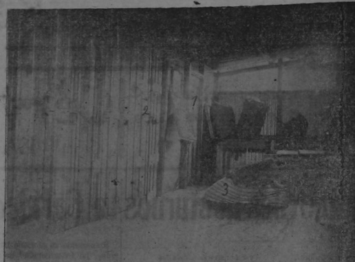
Interior del Palomar de la casa de Bermúdez, (1) Puerta del cuarto que ocupaba Solís y donde se presentó el incendio. (2) Cuarto del obrero español Juan Morales. (3) Colchón de la cama de Solís que se encontró mojado de canfin. (4) Puerta del cuarto que ocupaba el indiciado.

Comprar tiquete en la Estación de Las Pavas para la Charcalde y no para Puntarenas.